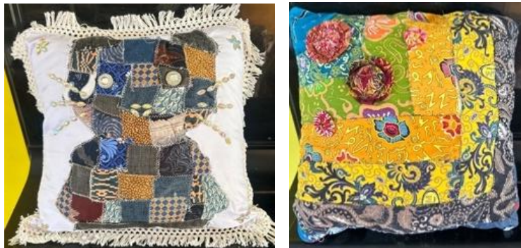
Gambar 6. Hasil karya patchwork

Tahap terakhir adalah finishing , yaitu penyempurnaan hasil karya melalui perapian benang, penyesuaian bentuk, serta evaluasi terhadap tampilan visual karya. Proses finishing dilakukan untuk meningkatkan kualitas estetika sekaligus fungsi karya yang dihasilkan. Pada tahap ini mahasiswa melakukan refleksi terhadap hasil akhir serta menilai kesesuaian karya dengan konsep awal yang telah dirancang.