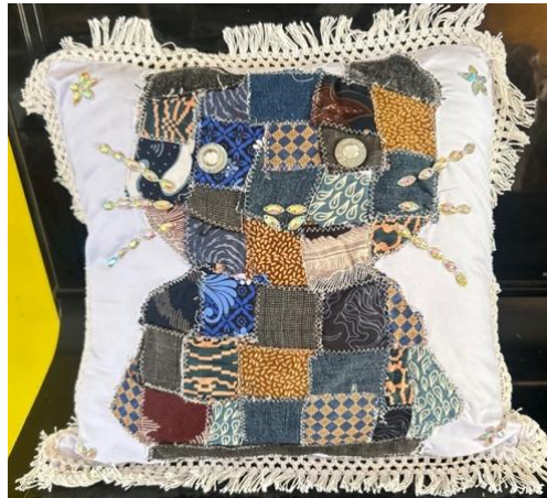
Gambar 8. Hasil karya 2