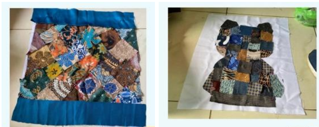
Gambar 4. Penyusunan komposisi

Tahap keempat merupakan penyusunan komposisi. Potongan-potongan kain disusun terlebih dahulu untuk melihat keseimbangan warna, motif, ukuran, dan hubungan antarunsur visual sebelum dilakukan proses penyambungan. Proses ini menjadi bagian penting karena mahasiswa melakukan eksplorasi artistik dengan mempertimbangkan prinsip desain seperti kesatuan, keseimbangan, proporsi, dan harmoni.