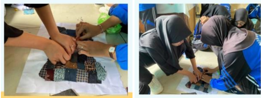
Gambar 5. Proses penjahitan karya

Tahap terakhir adalah finishing , yaitu penyempurnaan hasil karya melalui perapian benang, penyesuaian bentuk, serta evaluasi terhadap tampilan visual karya. Proses finishing dilakukan untuk meningkatkan kualitas estetika sekaligus fungsi karya yang dihasilkan. Pada tahap ini mahasiswa melakukan refleksi terhadap hasil akhir serta menilai kesesuaian karya dengan konsep awal yang telah dirancang.