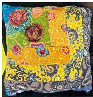
Gambar 7. Hasil karya 1