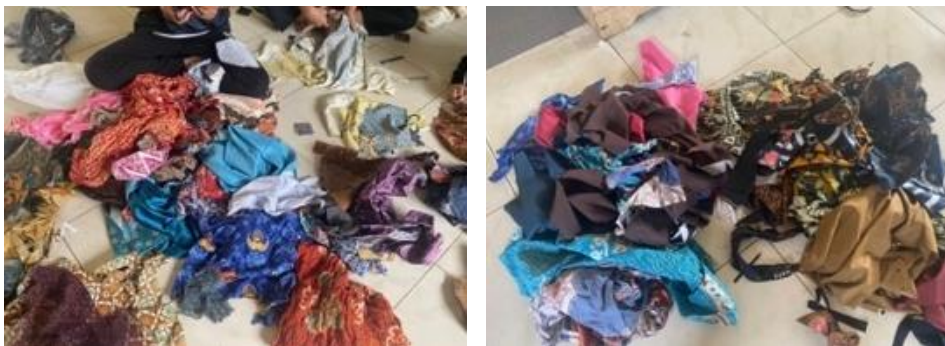
Gambar 1. Pemilihan bahan

Tahap pertama merupakan pemilihan bahan, yaitu proses menentukan jenis kain yang akan digunakan dalam pembuatan karya patchwork . Mahasiswa menggunakan kain perca dengan berbagai warna, motif, dan tekstur, termasuk kain bermotif Batik Besurek Bengkulu. Pemilihan bahan mempertimbangkan kesesuaian warna, ketebalan kain, serta potensi visual yang dapat dihasilkan. Tahap ini menunjukkan kemampuan mahasiswa dalam mengenali karakter material dan menyesuainya dengan konsep karya yang dirancang.