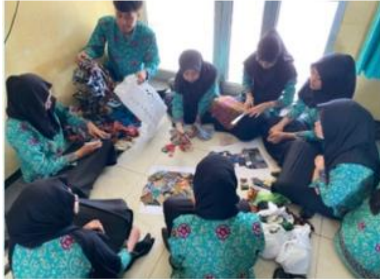
Gambar 3. Proses pemotongan kain

Tahap ketiga yaitu pemotongan bahan sesuai pola yang telah dirancang. Kain dipotong berdasarkan ukuran dan bentuk tertentu agar sesuai dengan desain yang telah ditentukan sebelumnya. Ketepatan pemotongan berpengaruh terhadap proses penyusunan dan kualitas hasil akhir karya. Pada tahap ini terlihat kemampuan mahasiswa dalam menerapkan ketelitian dan koordinasi visual saat mengolah material.