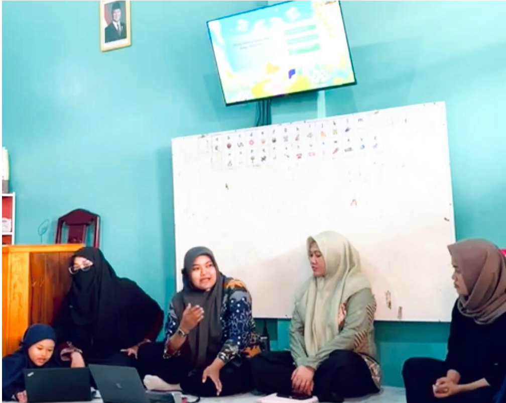
Gambar 3. Diskusi dan Refleksi Pengasuhan Peserta

Temuan tersebut diperkuat melalui hasil umpan balik peserta yang menunjukkan bahwa kegiatan membantu orang tua melakukan evaluasi terhadap pola pengasuhan yang selama ini diterapkan dalam lingkungan keluarga. Orang tua mulai memahami pentingnya konsistensi dalam mendampingi perkembangan anak serta pentingnya membangun lingkungan rumah yang mendukung perkembangan sosial dan emosional anak. Kondisi tersebut menunjukkan bahwa kegiatan Smart Parenting tidak hanya memberikan tambahan pengetahuan, tetapi juga membantu peserta membangun kemampuan reflektif terhadap praktik pengasuhan yang selama ini dilakukan.