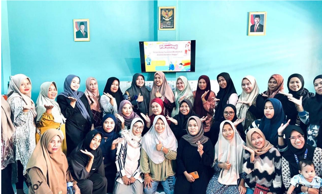
Gambar 4. Dokumentasi Akhir Kegiatan Smart Parenting