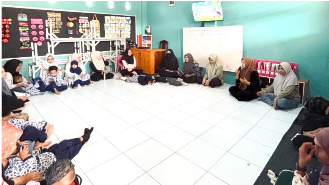
Gambar 2. Sesi Sharing Experience Orang Tua

Pelaksanaan kegiatan dilanjutkan melalui sesi sharing experience yang menjadi bagian penting dalam pendekatan pembelajaran partisipatif. Pada sesi ini peserta diberikan kesempatan untuk menyampaikan pengalaman pengasuhan serta berbagai tantangan yang dihadapi dalam mendampingi perkembangan anak. Hasil refleksi peserta menunjukkan bahwa sebagian orang tua masih mengalami kesulitan dalam menjaga konsistensi aturan di rumah, membangun disiplin anak, membatasi penggunaan gawai, membangun komunikasi yang lebih positif ketika menghadapi perilaku anak yang kurang sesuai dengan harapan, serta menjaga konsistensi pembiasaan perilaku positif dalam kehidupan sehari-hari. Permasalahan yang disampaikan peserta menunjukkan bahwa tantangan pengasuhan tidak hanya berkaitan dengan kurangnya pemahaman mengenai pembentukan karakter anak, tetapi juga berkaitan dengan kemampuan orang tua dalam menerapkan strategi pengasuhan secara konsisten sesuai kebutuhan perkembangan anak. Temuan tersebut memperlihatkan bahwa pembentukan karakter anak memerlukan pendampingan yang dilakukan secara berkelanjutan serta membutuhkan penguatan kapasitas keluarga agar proses pembiasaan perilaku positif dapat dilakukan secara optimal dalam lingkungan rumah.