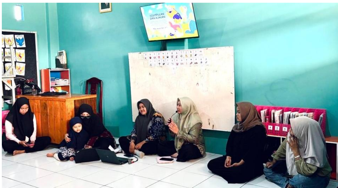
Gambar 1. Penyampaian Materi Smart Parenting

Selama proses penyampaian materi berlangsung, peserta menunjukkan keterlibatan aktif melalui respons terhadap pertanyaan yang diberikan serta kemampuan peserta menghubungkan materi dengan praktik pengasuhan dalam kehidupan sehari-hari. Berdasarkan hasil observasi selama kegiatan berlangsung, sebagian peserta mulai mampu mengidentifikasi bentuk pembiasaan perilaku positif yang dapat diterapkan dalam lingkungan keluarga seperti membangun disiplin waktu, membiasakan tanggung jawab terhadap aktivitas sederhana, serta membangun komunikasi yang lebih positif dengan anak. Temuan tersebut menunjukkan bahwa proses edukasi tidak hanya memberikan tambahan informasi kepada peserta, tetapi mulai mendorong kemampuan reflektif orang tua terhadap praktik pengasuhan yang selama ini diterapkan.