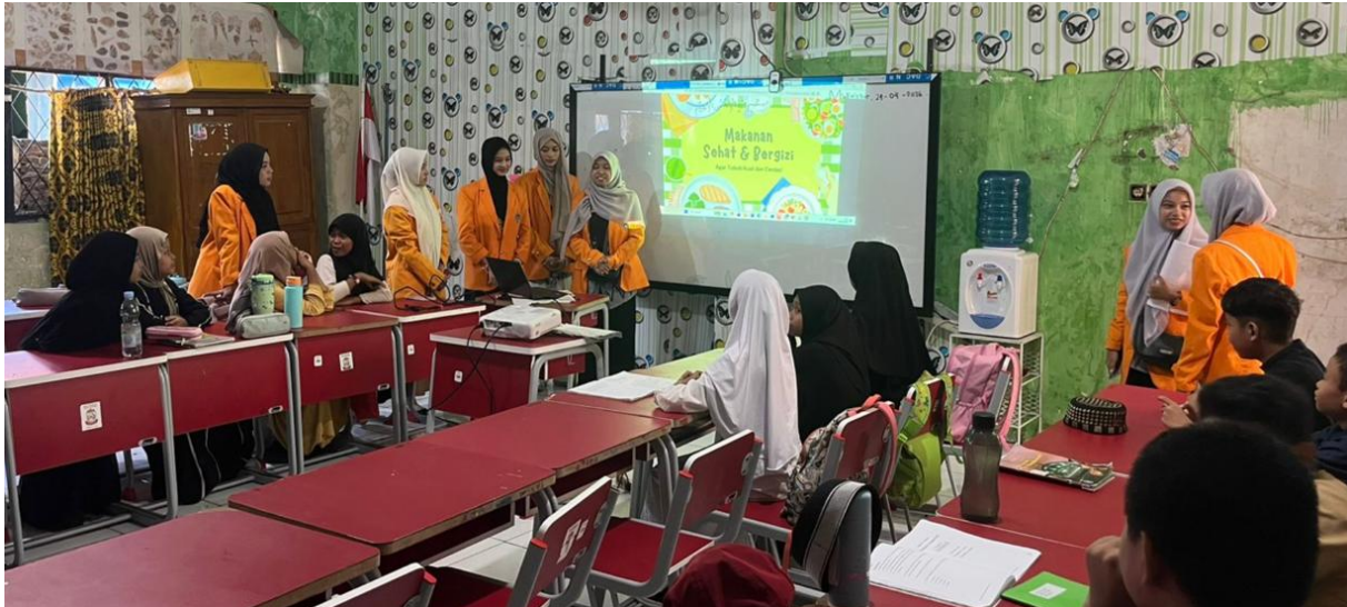
Gambar 1. Kegiatan Edukasi

Pada tahap awal kegiatan, siswa diberikan beberapa pertanyaan sederhana mengenai kebiasaan konsumsi makanan sehari-hari. Hasil observasi awal menunjukkan bahwa sebagian besar siswa lebih sering mengonsumsi makanan ringan kemasan, minuman tinggi gula, dan makanan cepat saji dibandingkan makanan sehat seperti buah dan sayur. Selain itu, sebagian siswa belum mampu membedakan makanan sehat dan tidak sehat berdasarkan kandungan gizinya.