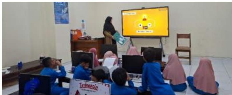
Gambar 2. Pengembangan media pembelajaran IPA di Sekolah Dasar

Pada aspek kompetensi profesional, mahasiswa berhasil mengembangkan media pembelajaran berbasis digital dan nondigital yang dimanfaatkan secara langsung dalam kegiatan pembelajaran di kelas penggunaan media tersebut mampu meningkatkan minat, partisipasi, dan keterlibatan siswa selama proses belajar berlangsung. Media pembelajaran yang dikembangkan mahasiswa juga membantu siswa memahami materi pembelajaran dengan lebih mudah dan menarik. Temuan ini sejalan dengan hasil penelitian Syafitri et al. (2025) yang menunjukkan bahwa penggunaan media digital, seperti aplikasi interaktif dan multimedia, mampu meningkatkan keterlibatan, fokus, dan minat belajar siswa sekolah dasar. Sejalan dengan itu, Nugroho et al. (2025) menemukan bahwa media pembelajaran digital berperan dalam meningkatkan partisipasi aktif dan antusiasme siswa serta mendukung pemahaman materi pembelajaran secara lebih optimal.