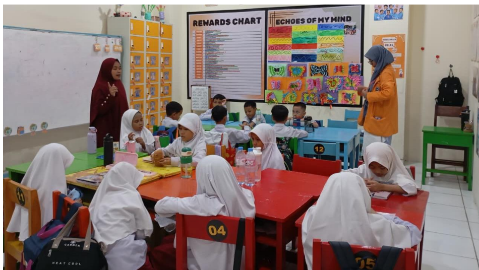
Gambar 4. Kolaborasi antara Guru dan Mahasiswa AMSD dalam Proses Pembelajaran

Selain itu, pendampingan tambahan yang diberikan kepada siswa turut mendukung proses belajar, khususnya bagi siswa yang membutuhkan pendampingan lebih intensif selama proses pembelajaran berlangsung. Keterlibatan mahasiswa dalam kegiatan literasi dan pendampingan siswa menunjukkan pentingnya kolaborasi antara mahasiswa dan guru dalam menunjang mutu pembelajaran di sekolah dasar. Hasil tersebut sesuai dengan penelitian Yulianti et al. (2024) yang menyatakan bahwa program asistensi mengajar mampu memperkuat pendampingan literasi siswa melalui kerja sama aktif antara mahasiswa dan pihak sekolah.