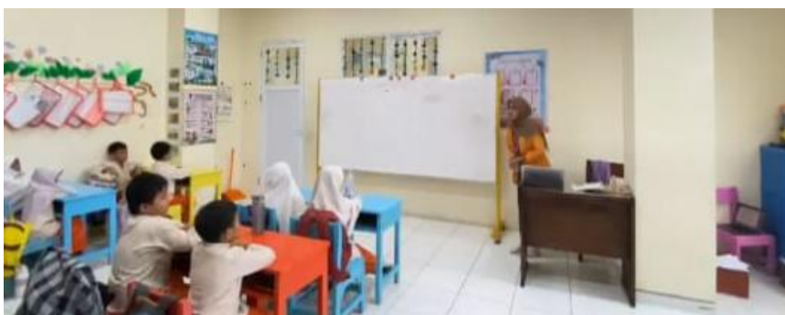
Gambar 1. Kegiatan Mahasiswa Mengajar di Kelas

Luaran berupa modul ajar, LKPD, bahan ajar, dan asesmen sederhana menunjukkan bahwa mahasiswa tidak hanya terlibat dalam praktik mengajar, tetapi juga dalam proses perencanaan pembelajaran. Penyusunan perangkat tersebut menjadi bagian penting dari penguatan kompetensi pedagogis karena mahasiswa belajar menyesuaikan tujuan pembelajaran, materi, aktivitas belajar, dan evaluasi dengan kebutuhan siswa sekolah dasar. Dengan demikian, luaran perangkat pembelajaran menjadi bukti konkret bahwa program AMSD tidak hanya menghasilkan pengalaman lapangan, tetapi juga produk pembelajaran yang dapat mendukung proses belajar di sekolah mitra.