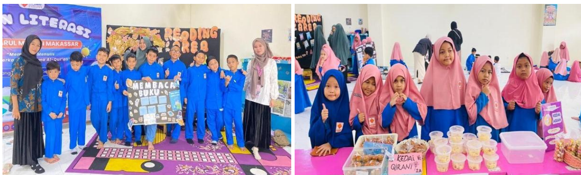
Gambar 3. Mahasiswa berkolaborasi dengan pihak sekolah dalam kegiatan Pekan Literasi dan Market Day

Kompetensi sosial mahasiswa juga mengalami peningkatan melalui interaksi yang intensif dengan siswa, guru pamong, dan seluruh warga sekolah selama pelaksanaan program. Mahasiswa mampu membangun komunikasi yang baik serta berkolaborasi dalam berbagai kegiatan pembelajaran dan aktivitas sekolah. Selain itu, sikap disiplin, tanggung jawab, dan kemampuan beradaptasi yang ditunjukkan mahasiswa selama kegiatan berlangsung menjadi indikator berkembangnya kompetensi kepribadian mahasiswa sebagai calon pendidik profesional. Hasil ini selaras dengan penelitian Sari dan Setiawan (2021) yang menjelaskan bahwa kompetensi sosial calon guru terlihat dari kemampuan berkomunikasi secara efektif, menjalin kerja sama, dan membangun hubungan interpersonal yang positif di lingkungan sekolah. Selain itu, Pratiwi dan Nugroho (2022) menjelaskan bahwa kegiatan praktik lapangan dan pengalaman mengajar berkontribusi terhadap pengembangan kompetensi sosial dan kepribadian mahasiswa, terutama dalam aspek disiplin, tanggung jawab, kemampuan beradaptasi, dan etika profesi.