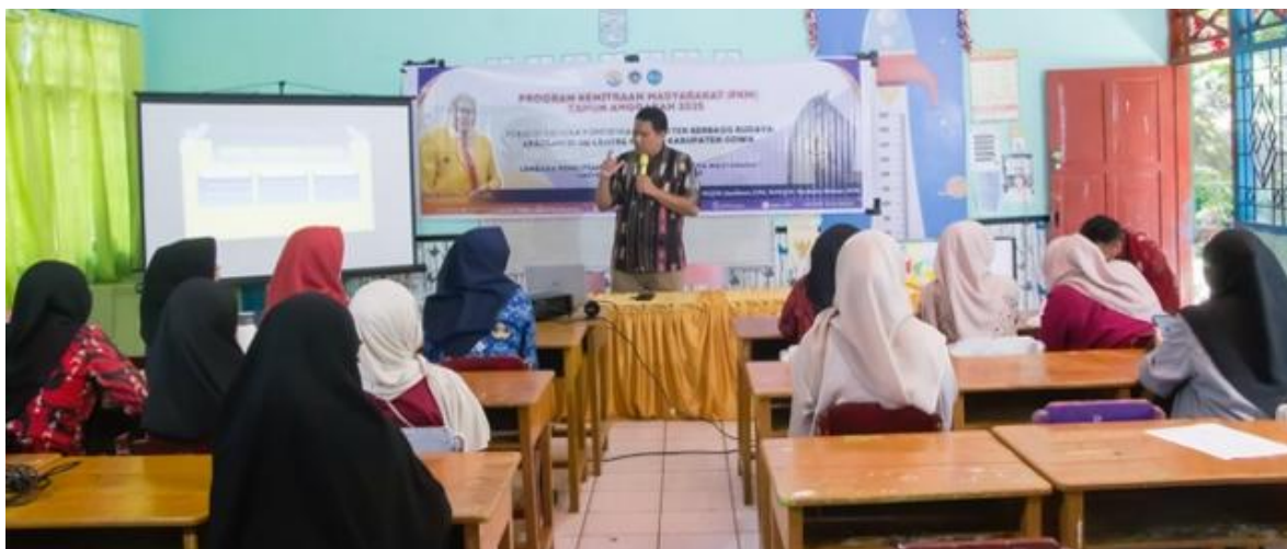
Gambar 4. Pemanfaatan Google Classroom dalam Pelatihan

Selain Google Classroom , komunikasi dan pendampingan peserta juga dilakukan melalui grup WhatsApp. Platform ini digunakan untuk memfasilitasi diskusi informal, berbagi pengalaman implementasi program budaya sekolah, serta mendukung koordinasi antara fasilitator dan peserta selama proses pendampingan. Interaksi yang berlangsung secara berkelanjutan membantu membangun komunitas belajar dan kolaborasi antarguru dalam pengembangan pendidikan karakter berbasis budaya sekolah.