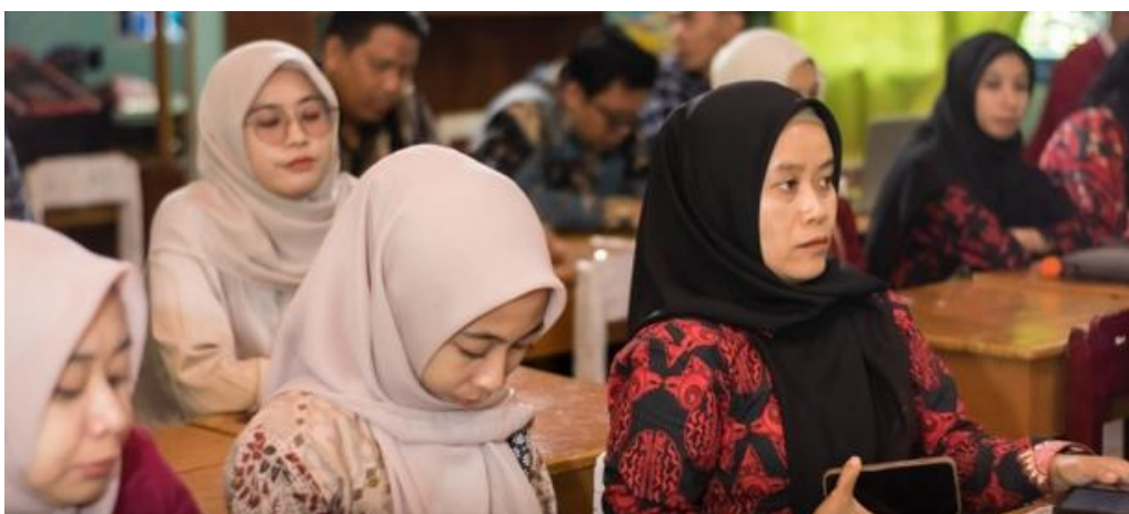
Gambar 3. Aktivitas Peserta dalam Diskusi dan Praktik Program Budaya Sekolah

Data partisipasi peserta menunjukkan bahwa metode pelatihan yang interaktif dan kolaboratif mampu meningkatkan keterlibatan peserta selama kegiatan berlangsung. Metode diskusi, simulasi, dan praktik langsung memberikan kesempatan kepada peserta untuk memahami implementasi pendidikan karakter secara lebih aplikatif dibandingkan pendekatan ceramah satu arah.