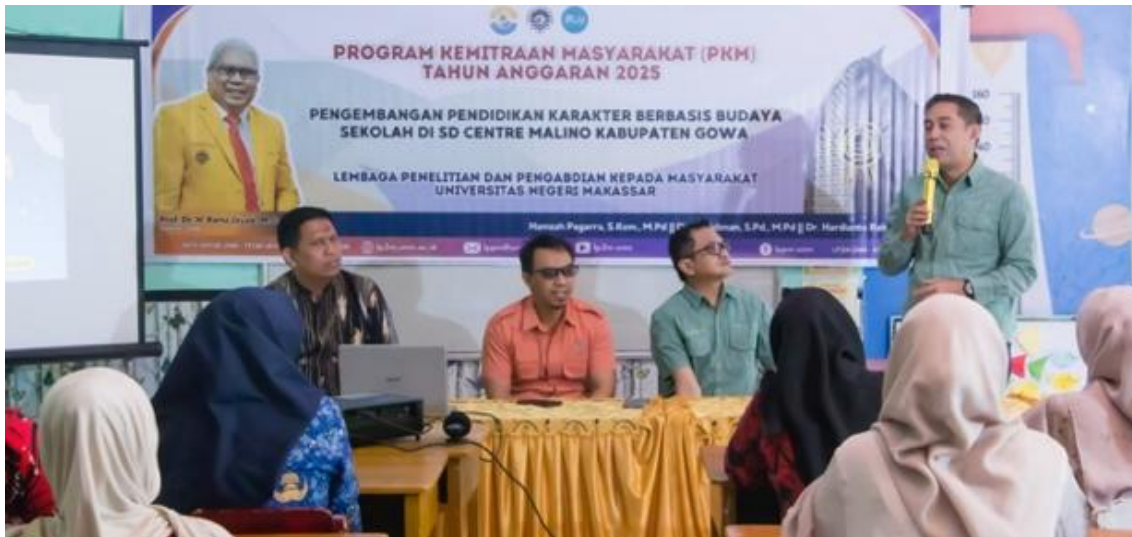
Gambar 1. Pembukaan Kegiatan Pelatihan

Pelaksanaan pelatihan menunjukkan tingkat partisipasi peserta yang relatif tinggi. Pada hari pertama, tingkat partisipasi peserta mencapai 85%. Tingginya partisipasi tersebut menunjukkan respons positif peserta terhadap materi pengenalan pendidikan karakter dan budaya sekolah. Diskusi dan kegiatan berbagi pengalaman yang dilakukan selama sesi pelatihan membantu menciptakan suasana pembelajaran yang kolaboratif dan interaktif.