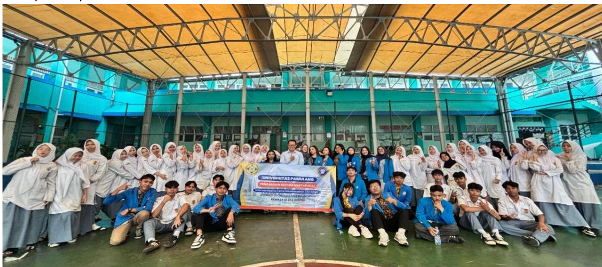
Gambar 1. Dokumentasi foto bersama tim PKM dan peserta sebagai penutup kegiatan Pengabdian kepada Masyarakat di SMK Muhammadiyah 1 Tangerang

Secara keseluruhan, hasil kegiatan menunjukkan bahwa pendekatan pembelajaran ekonomi berbasis pengalaman nyata mampu meningkatkan pemahaman, keterampilan, serta kesiapan mental siswa dalam menghadapi dunia kerja dan usaha. Dengan adanya peningkatan yang terukur secara kuantitatif dan didukung oleh perubahan sikap siswa, kegiatan PKM ini tidak hanya memberikan manfaat praktis, tetapi juga memiliki kontribusi secara akademik dalam pengembangan model pembelajaran ekonomi yang lebih kontekstual dan relevan dengan kebutuhan siswa. Kegiatan PKM diakhiri dengan sesi dokumentasi bersama sebagai bentuk penutup kegiatan serta mempererat hubungan antara tim pelaksana dan peserta, seperti ditunjukkan pada Gambar 1.