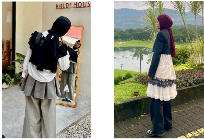
Gambar 2. Tren layering

Proses adaptasi ini sesuai dengan konsep “ everyday life performance ” (Goffman 1959), yang dikontekstualisasikan dalam ruang geografis lokal dimana remaja tidak serta merta meniru tren secara utuh seperti penggunaan tren layering (berlapis) yang lazim, tetapi memodifikasi substansi materialnya dengan mencari bahan yang sesuai dengan iklim setempat agar dapat tetap nyaman beraktivitas (lihat Gambar 2 di bawah ini). Selain itu, proses glokalisasi terlihat sangat nyata dalam cara informan menyaring dan memodifikasi pengaruh global. Di sini, fungsi pakaian meluas dari sekedar kenyamanan fisik menjadi fungsi moral-kultural (kesopanan).