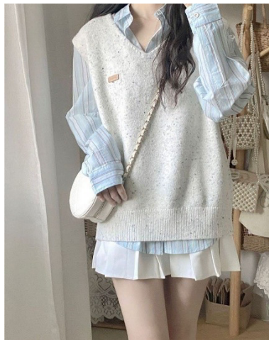
Gambar 1. Fashion Korea dengan Konsep Clean Look dan Simple Elegant