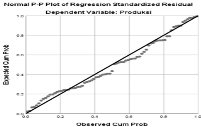
Gambar 1. Hasil Uji Normalitas

Data dikatakan berdistribusi normal jika titik-titik menyebar disekitar garis diagonal, dan mengikuti garis diagonal.